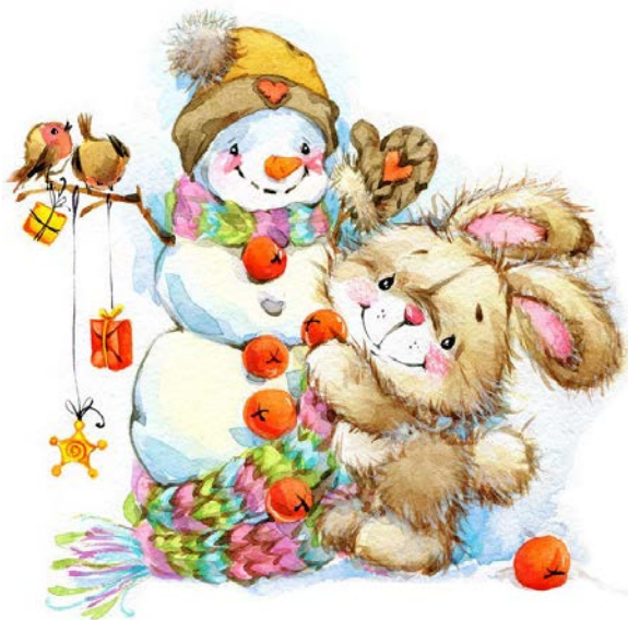
Слепи снеговика (из пластилина, из снега)

Совет и задание для девочек и мальчишек: Во дворе лежит снежок: Выходи гулять, дружок! Санки с горочки катить, Бабу снежную лепить!